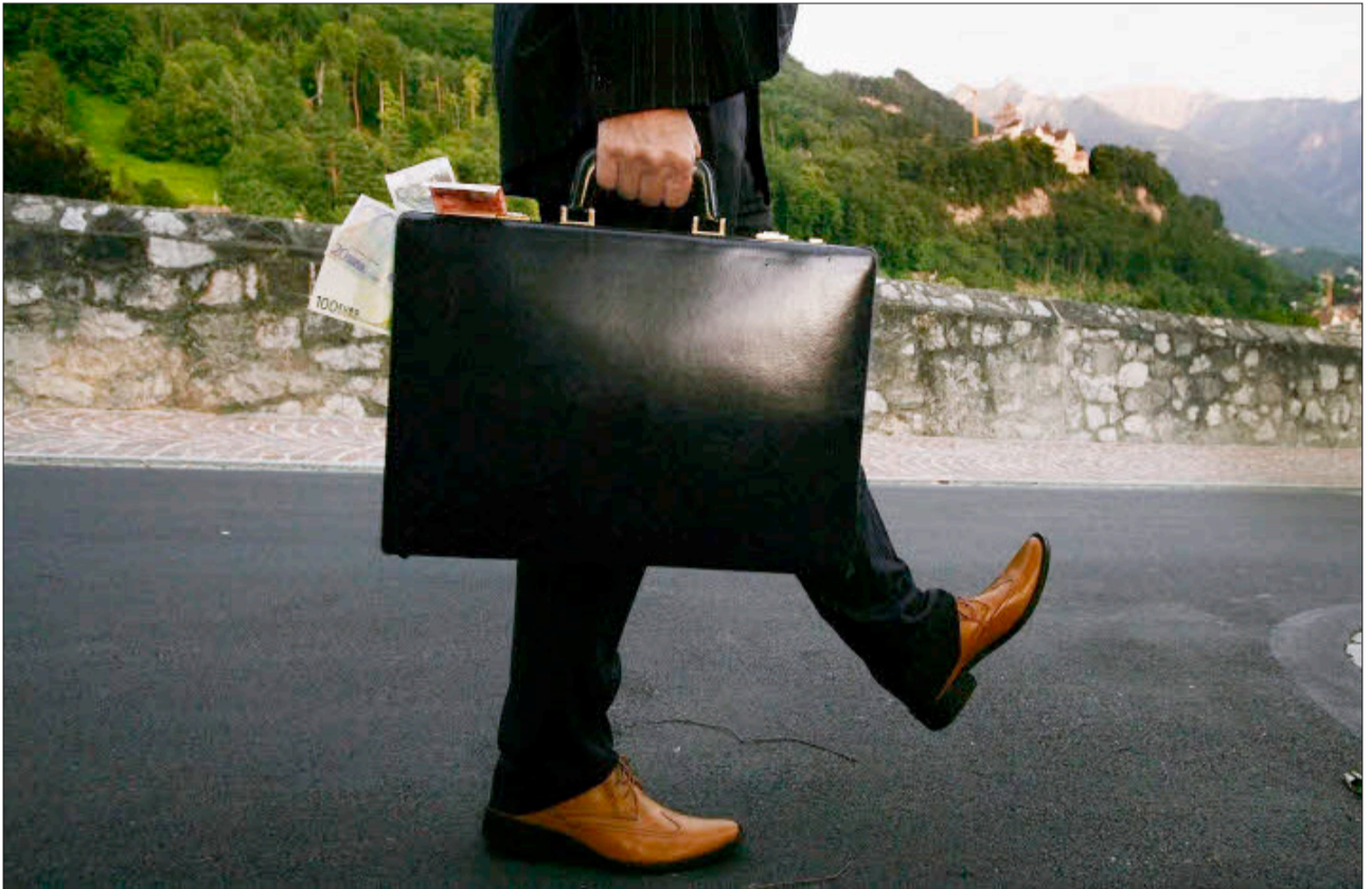
Ein kleiner Schritt für den Steuerbetrüger, ein großer für die Stimmung im Land.