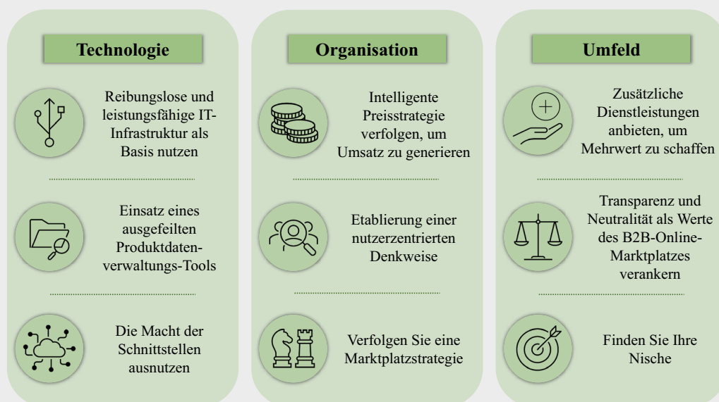
Abb. 3 Eigene Darstellung, Übersicht der neun Designprinzipien

Das Einsetzen von Netzwerk-, Skalen- und Lock-in-Effekten ist entscheidend für den Erfolg eines B2B-Online-Marktplatzes