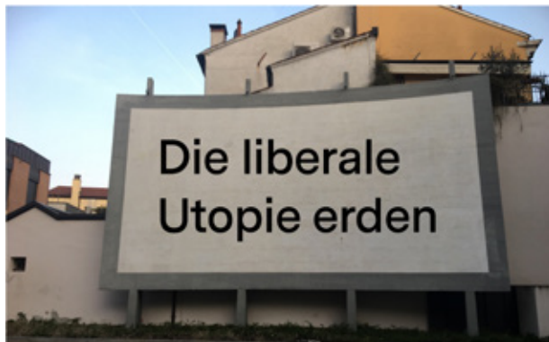
Kernbotschaft für Imagineure und Transformatikerinnen

Harald Welzer und ich haben einige Elemente dieser Haltung schon in unserem Imagineering-Buch angesprochen: positiver Trotz, dynamische Ziellosigkeit, herzliche Schamlosigkeit. 15 Eine solche Haltung wächst über die Zeit und verstärkt sich, wie alle Tugendethiker wissen, mit jedem Schritt. Daher ist die Suche nach einem vertretbaren Leben, vor sich selbst, vor den (eigenen) Kindern, vor der Welt, keine leichte Übung; es steht keine Toolbox mit Lösungen zur Verfügung. Sie beinhaltet Zweifel, Scheitern und schenkt doch Momente ungläubig beäugter Freiheit; Stichwort: weniger ist mehr. Ganz sicher aber ist sie eines: alternativlos.