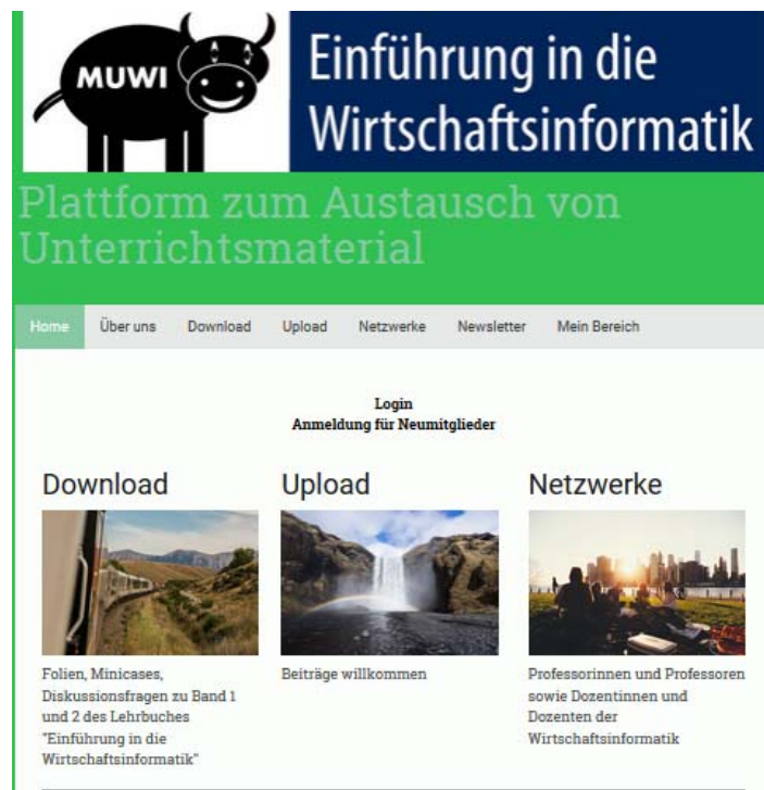
Abb. 1: Prototyp Lehrplattform für Dozenten (Ausschnitt)

Ein Online-Netzwerk, um sich mit anderen Lehrenden auszutauschen und Materialien für Vorlesungen zu teilen, wurde von drei der Befragten gewünscht.