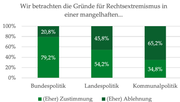
Abbildung 2: Betrachtungen der Verantwortlichkeiten auf politischen Ebenen

Eindeutig weisen die Kammer der Bundespolitik die größte Bedeutung bei, knapp 80 Prozent erkennen hierin zumindest teilweise die Ursache. Dahingehend wird der Einfluss der Landespolitik als weniger bedeutsam erachtet und nur noch rund die Hälfte der Kammern (54,2 %) kann hier zumindest teilweise den Ursprung rechtsextremistischer Bewegungen ausmachen. Auf der Ebene der Kommunalpolitik verorten nur relativ wenige Kammern (34,8 %) mindestens teilweise die Ursprünge und Treiber für Rechtsextremismus.